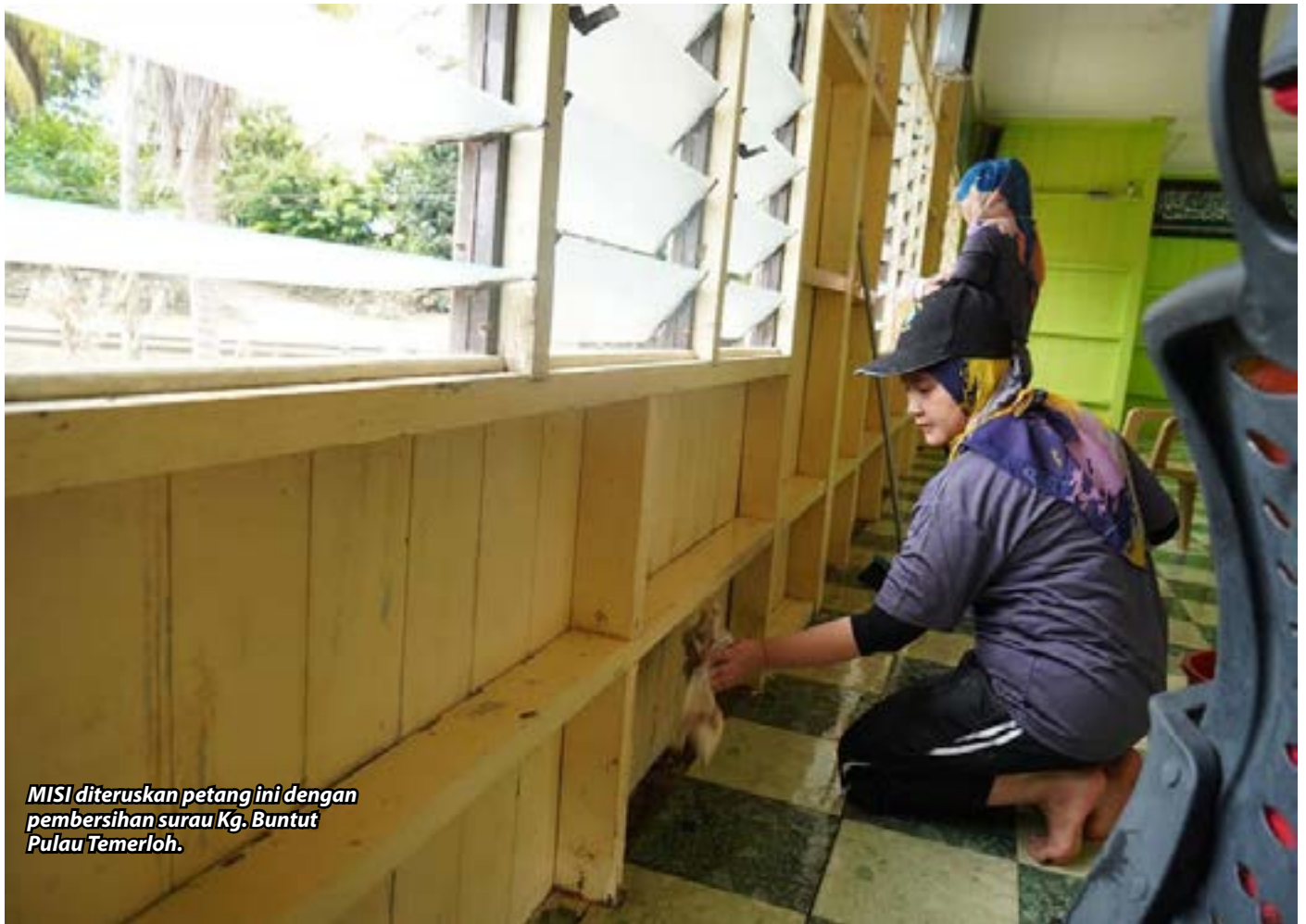
MISI diteruskan petang ini dengan pembersihan surau Kg. Buntut Pulau Temerloh.