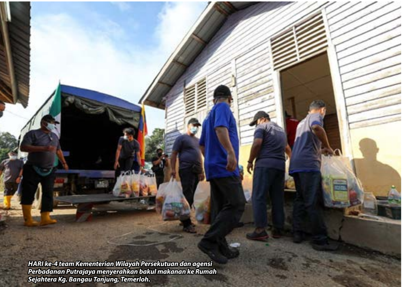
HARI ke-4 team Kementerian Wilayah Persekutuan dan agensi Perbadanan Putrajaya menyerahkan bakul makanan ke Rumah Sejahtera Kg. Bangau Tanjung, Temerloh.