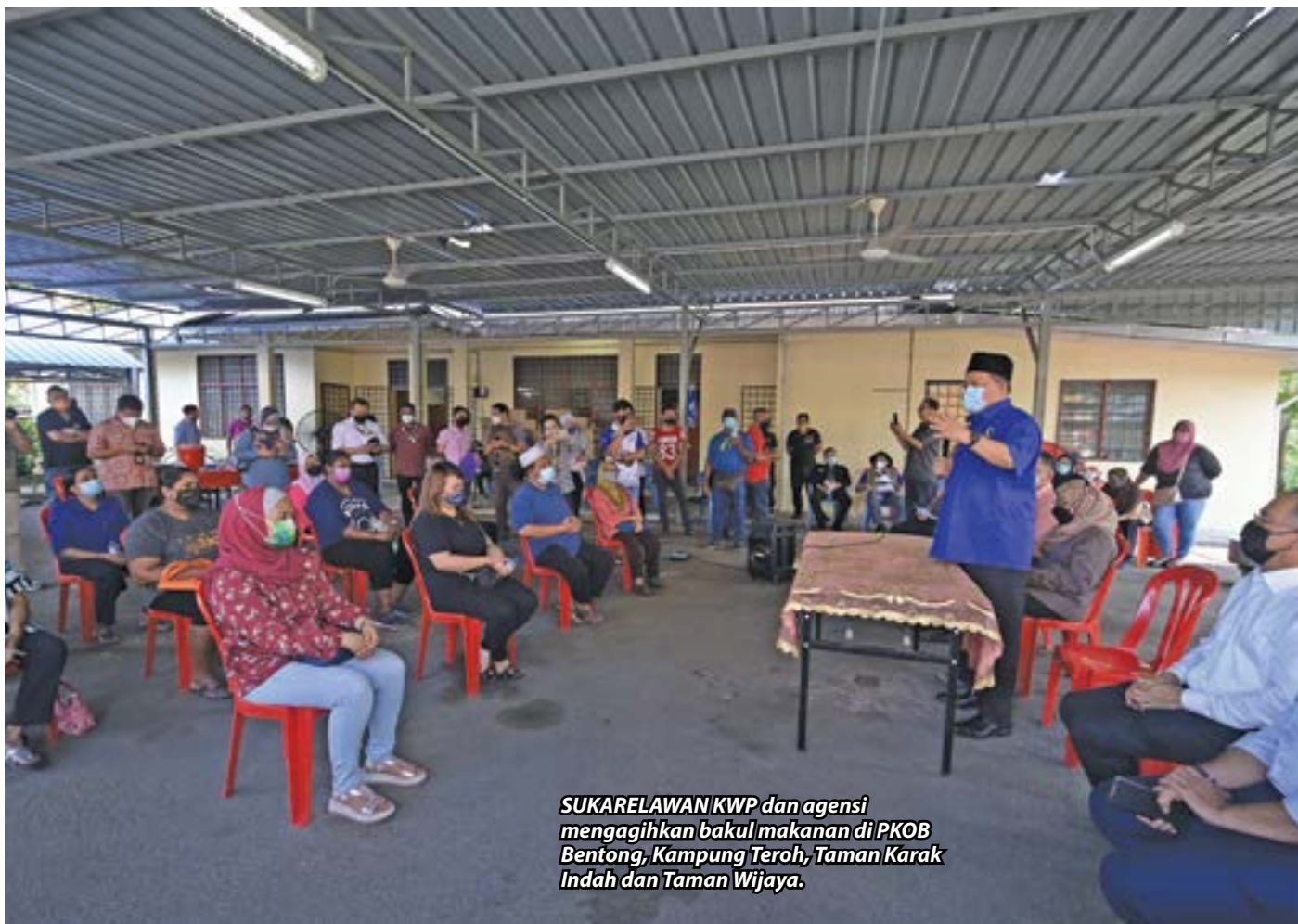
SUKARELAWAN KWP dan agensi mengagihkan bakul makanan di PKOB Bentong, Kampung Teroh, Taman Karak Indah dan Taman Wijaya.