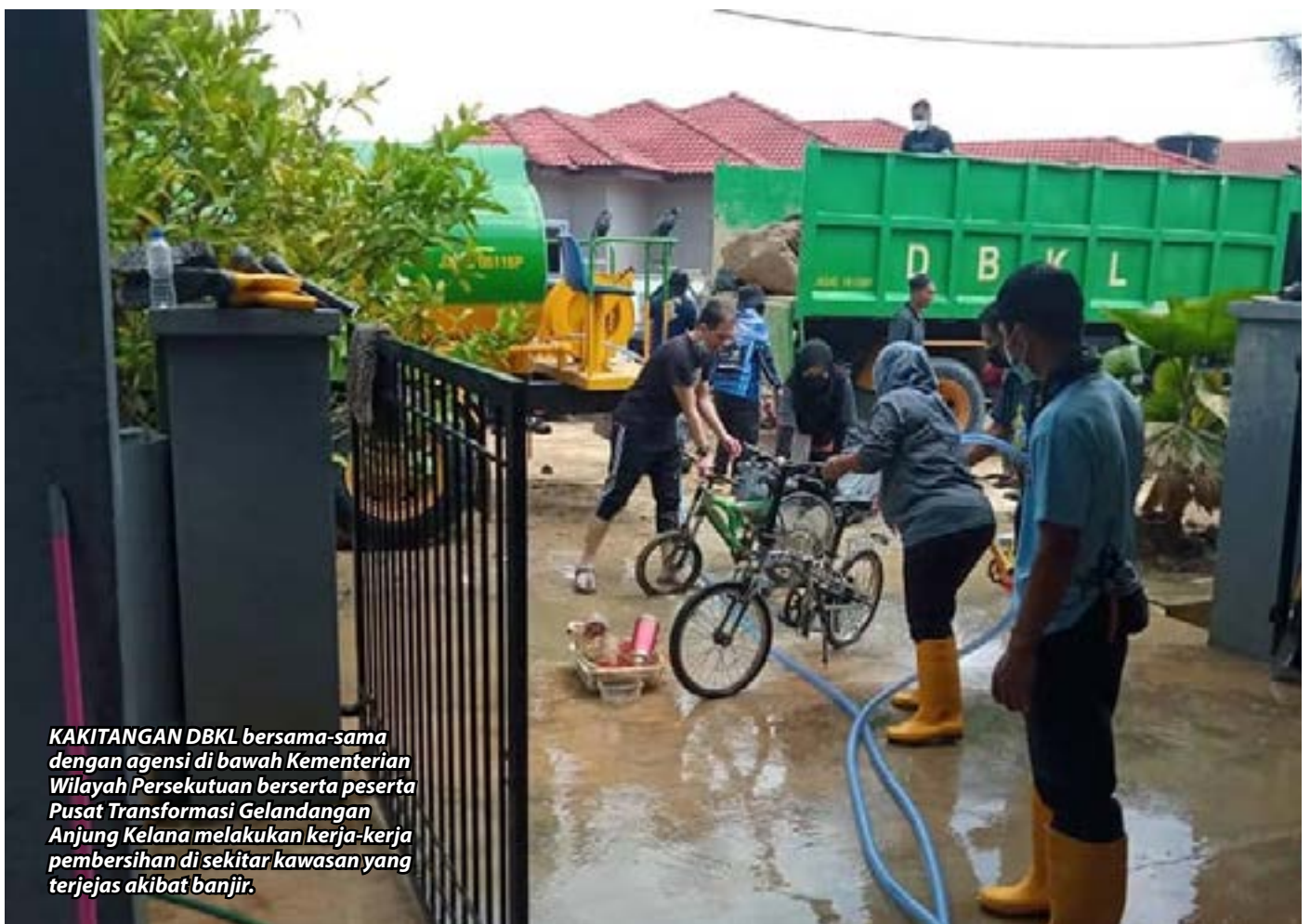
KAKITANGAN DBKL bersama-sama dengan agensi di bawah Kementerian Wilayah Persekutuan berserta peserta Pusat Transformasi Gelandangan Anjung Kelana melakukan kerja-kerja pembersihan di sekitar kawasan yang terjejas akibat banjir.