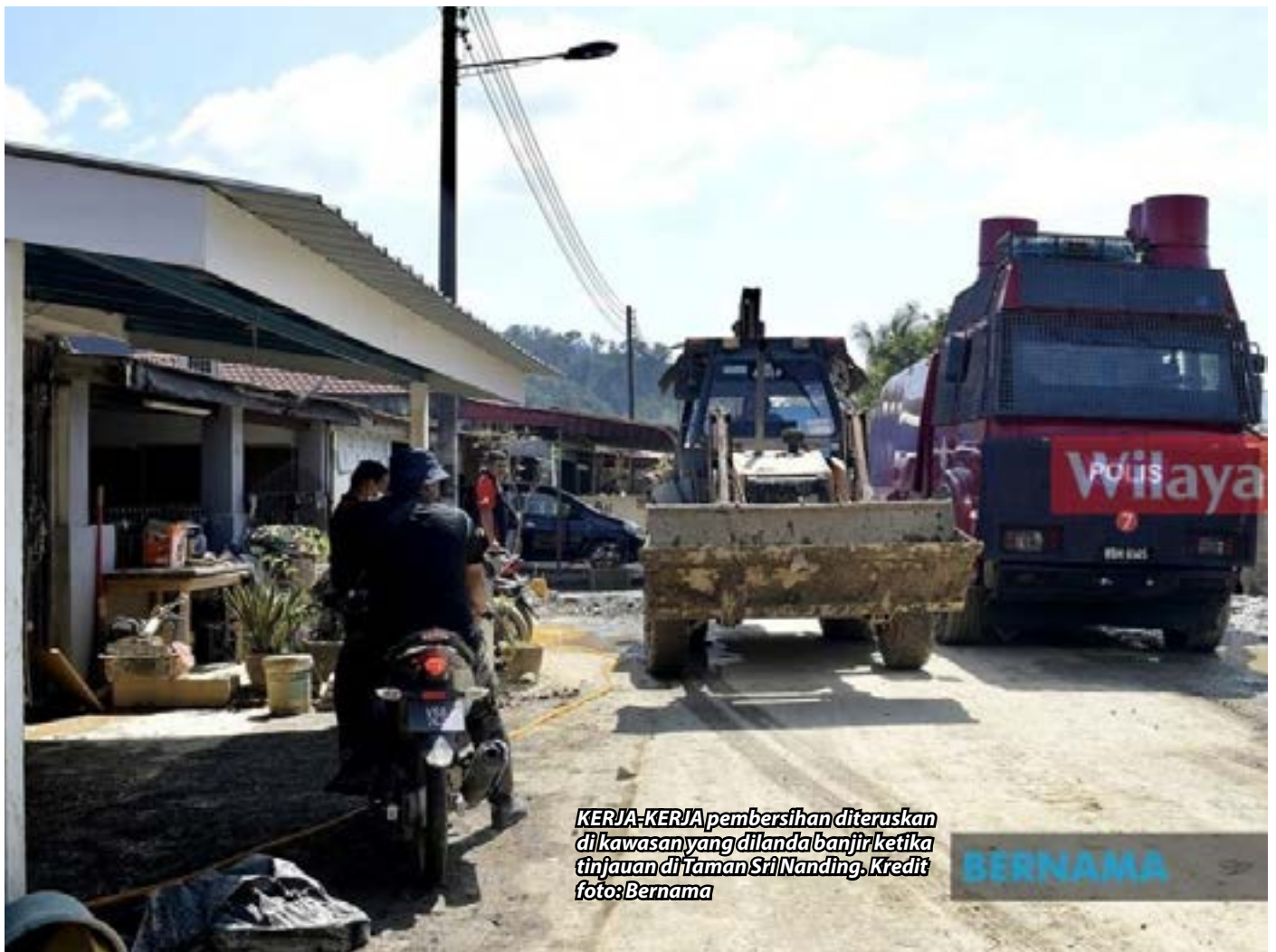
KERJA-KERJA pembersihan diteruskan di kawasan yang dilanda banjir ketika tinjauan di Taman Sri Nanding.